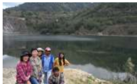
フィリピンルボ村鉱山跡地