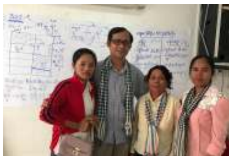
緑の芽有機農園学校(カンボジア)