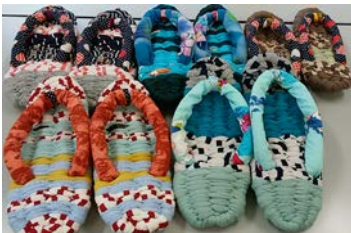
「布ぞうり」Tシャツならではの美しい色合い