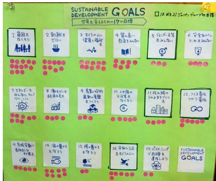
世界を変えるための17の目標シールアンケート

今年は国連が定めた「持続可能な開発のためのグローバル目標(SDGs※)」とのつながりから貧困を生み出す私たちの社会について考えました。