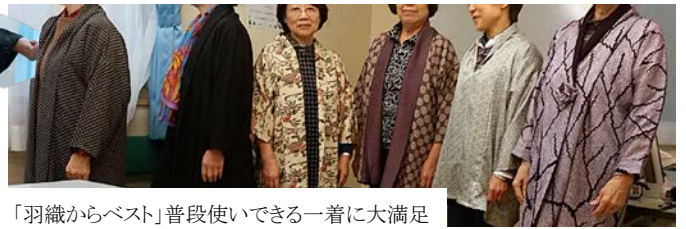
「羽織からベスト」普段使いできる一着に大満足