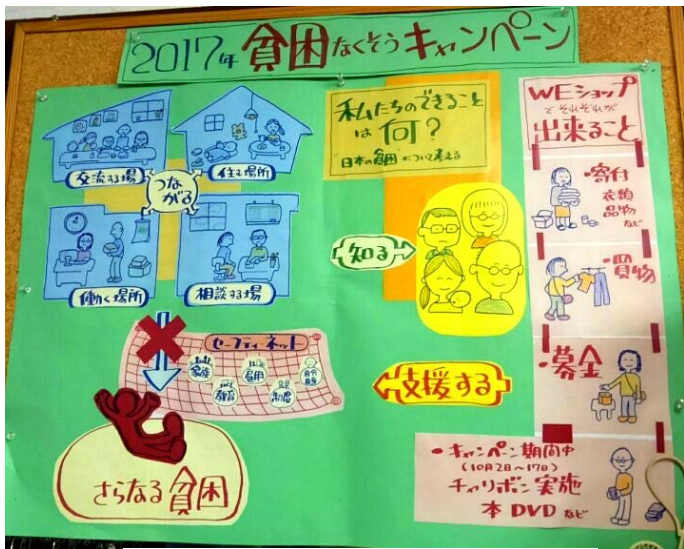
貧困を生み出すわたしたちの国の社会構造を図説

例えば、「外食では責任を持って食べられる量だけを注文する」「使っていない部屋の電気は消す」など、些細なことに思えますが、積み重なると大きな変化に！私たちの何気ない行動の一つ一つが、世界とつながっているのです。