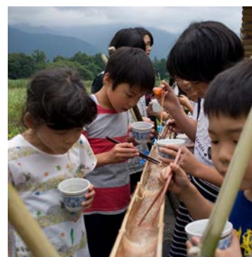
「福島ぼかぼかプロジェクト」保養地で流しそうめんを楽しむ子どもたち