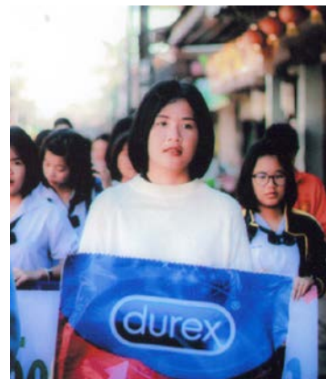
タイ・エイズデーの様子