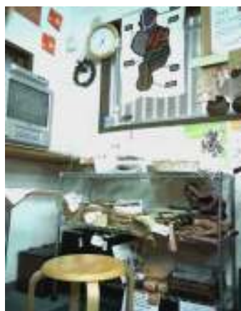
天王町店 フェアトレードコーナー

10月17日の“世界貧困撲滅キャンペーン”に今年も参加し、支援先の情報を発信し、現状について学び・知る場とします。