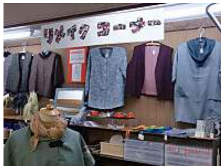
星川店 リメイクコーナー

リユース・リサイクルショップ「WE ショップ 星川店、天王町店」は、地域の皆さまの貴重な寄付品を有効活用し、販売とリメイクをさらに充実させます。