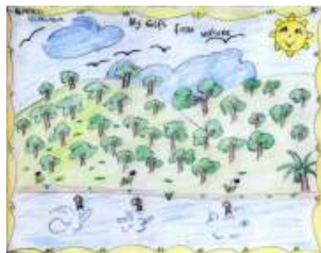
クレヨンキャンペーン 贈ったクレヨンで子どもたちが絵を書き、毎年送ってくれます

東日本大震災被災からの復興支援は、今年度も継続し毎月11日の売上から20%と、3月11日の売上全額を寄付します。被災地からの手作り品も販売しますのでご協力ください。