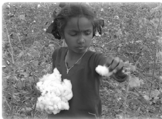
インド綿花農園で働く少女

たとえば、西アフリカのカカオ農園でカカオ豆を採集するために大ナタを使っての作業をする少年や、インドで農薬の被害にさらされながら綿花摘みをする少女などがいます。