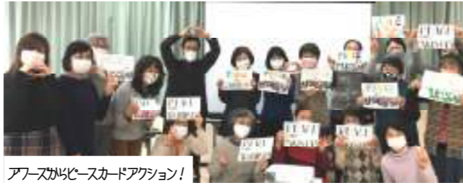
アースからピースカードアクション!

今回は感染予防に努めながら、会員、関係者のみへの呼びかけで開催しました。直接お話を聞いたことで、有意義な意見交換の場となり、参加者たちの心に響く報告会になりました。対面での開催の良さも実感しました。(黒木)