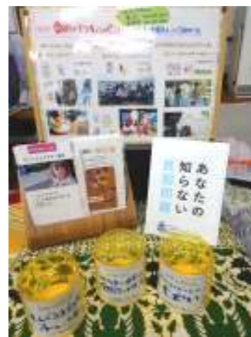
「世界食料デー」食品ロス削減と飢餓ゼロに取り組む日 「貧困撲滅のための国際デー」世界の貧困撲滅を考える日

ますます、世界中で急速に格差が広がっていく中、貧困を無くすため、自分が出る事は何かを考えるきっかけを作っていきたい。これからもみんなが協力して安心して暮らせるまちづくりを目指して、「誰一人置き去りにしない」というSDGsの理念をWEショップから発信していきます。(伊達)